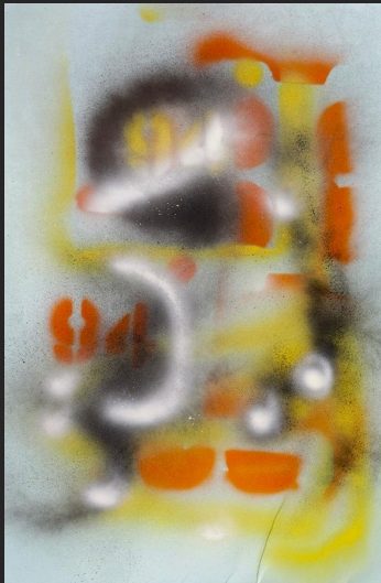
Klemens Wutke, 2022

Sprayworkshop mit Diethard Riedel für Kinder, Jugendliche, Künstler/innen und Kunst- interessierte