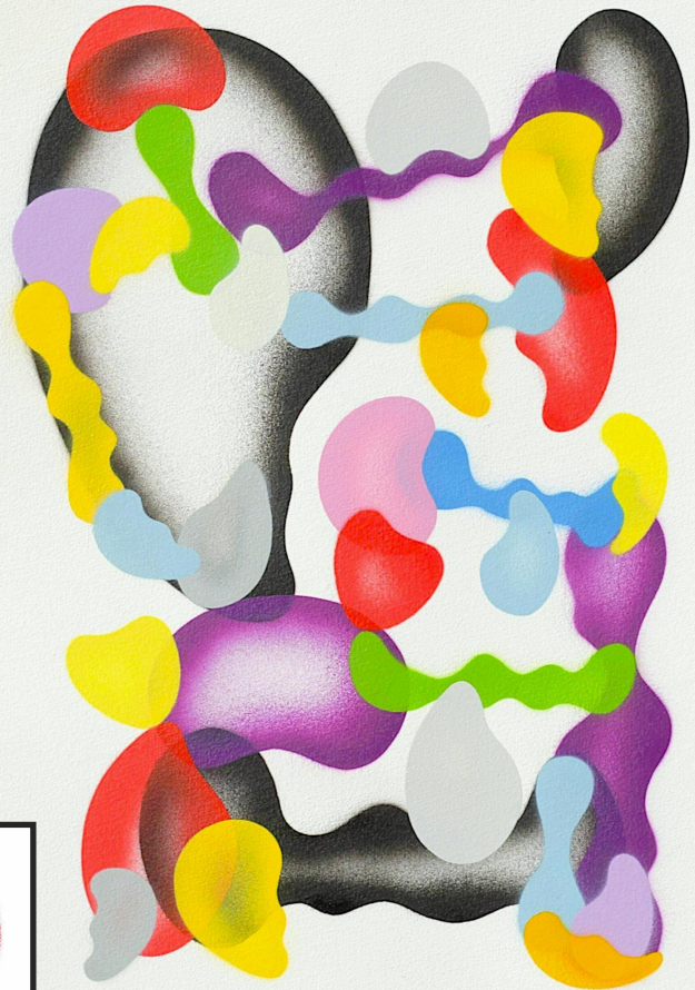
Diethard Riedel, 2025

modern spray art foundation the whole truth about sprays