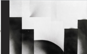
Antonia (14 Jahre), 2022

Tägliche Führungen durch die Werkschau mit Diethard Riedel, jeweils um 18:00 Uhr