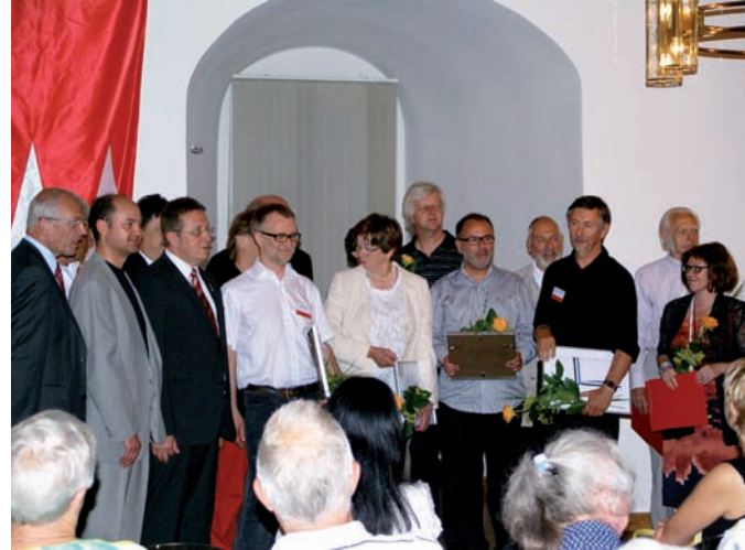
Bei der Vernissage wurden die Preisträger geehrt

Das Thema des Kunstwettbewerbes bietet vielfältigen Interpretationen Raum. Es ist aktueller denn je, weil das 21. Jahrhundert wie keine Zeit zuvor bestimmt ist von Kommunikation und Migration über Ländergrenzen hinweg. „FREMDE FREUNDE“ eröffnet in seiner Ambivalenz ein weites Spektrum an möglichen Assoziationen. Sie reichen von Exil, Krieg, Vertreibung, über Wirtschaftslucht und Gastarbeit, bis hin zu touristischen Aspekten, die sich mit der modernen Freizeitgesellschaft verbinden. Es sind Faktoren, wie sie auch das Leben in Franken geprägt haben und weiterhin prägen.