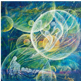
Angelika Meitzel, »Erwachen«, Acryl auf Lwd., 40 x 40 cm, 2022